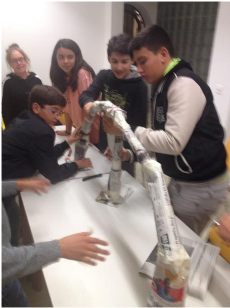
Equipe de Villars