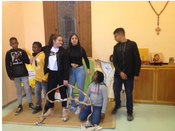
Equipe de Bex avec les enfants du catéchisme