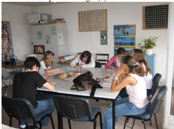
Rencontre des délégué(e)s adolescents le 26 mai à Lausanne.