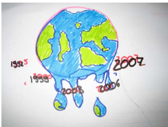
Dessin réalisé par les délégué(e)s adolescents.